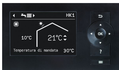
Regolazione Vitotronic 200

Grazie alla App dedicata ViCare, è possibile gestire la temperatura e lo stato di funzionamento dell'impianto, comodamente dal proprio smartphone.